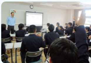
各国の文化や生活の紹介