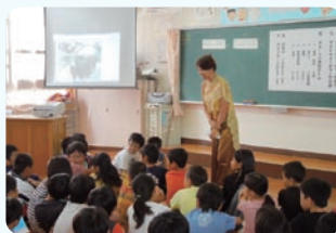
講師による自国の紹介