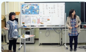
アフリカの現状を説明