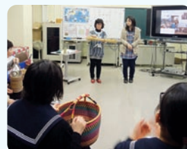
日本の取り組みを紹介