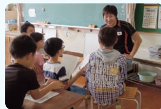
小グループで講師への質問タイム