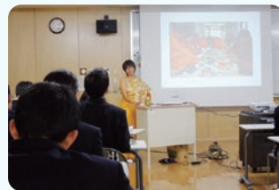
日本との違いを考える