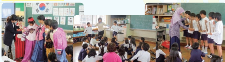
アジアの国の子どもたちの歌や遊びを体験する。