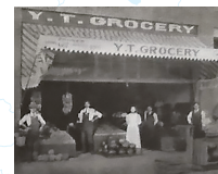
カリフォルニア州ロングビーチの富士松商会