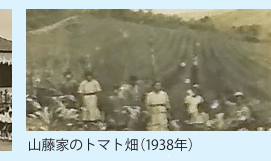
山藤家のトマト畑(1938年)