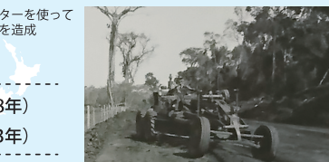
トラクターを使って移住地を造成