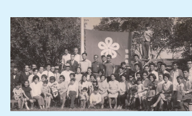
戦後は約12000人が移住。福岡県人会は1965年に誕生