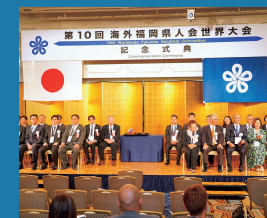
第10回大会開催を記念した式典

県人会同士の交流の場を設けるため、1992年より「海外福岡県人会世界大会」を3年に一度開催している。2019年は、6年ぶりに母県・福岡で開催し、世界21ヶ国・地域の29県人会から約350名が集まり、県内各地で様々な交流事業を行った。