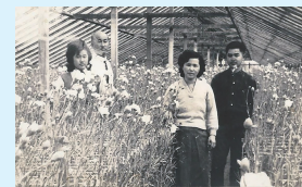
観賞用の花などを栽培する日系人が多かった