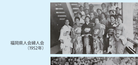
福岡県人会婦人会(1952年)