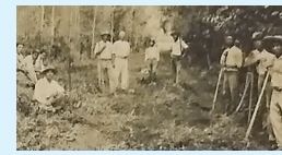
道路づくりから始まった「福博村」の草創期