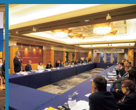
県人会代表者による会議