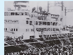
アルトパラナ移住者第1陣を乗せて出港するあめりか丸(1960年)