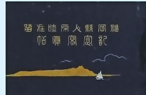
「福岡県人布駐在留記念写真帖」(秦事務所、1924年発行)