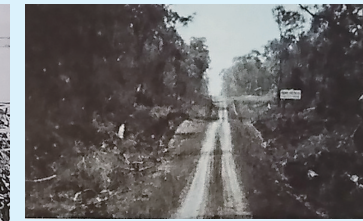
パラグアイのアルトパラナ移住地の看板が原始林の中に見える