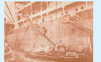
船はペルー沿岸を航行し、各港で移民を降ろしていった