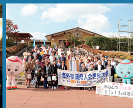
県人会のふるさと巡回