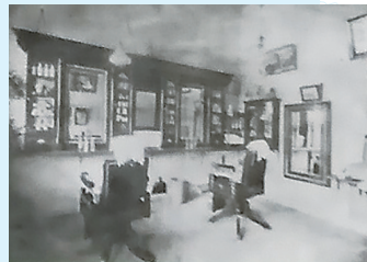
ホノルルのダウンタウンにあった太田理髪店