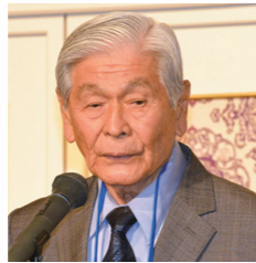
ジョージ・アリヨシ 1926～

祖父が現在の八女市出身の日系2世。ハワイ・ホノルル生まれ。第2次世界大戦で米軍に従軍し、陸軍大尉を務めた後、米国初の日系人議員に。上院議員として長く活躍し、上院仮議長として大統領継承順位第3位になった。