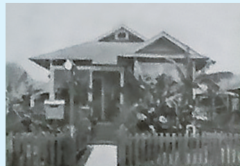
ホノルルの中央病院。移住者も専門職に進出していった