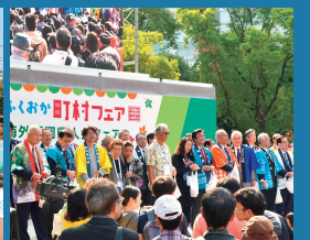
各国芸能披露や屋台出店を行ったフェア