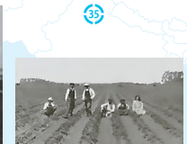
カリフォルニア州ガーデナ、共同経営のいちご園