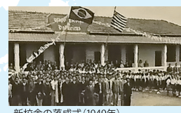
新校舎の落成式(1949年)