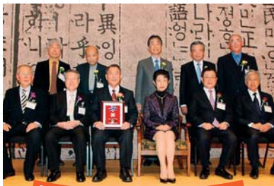
타카마도노미야 상을 수상하는 모습

일본 및 한국에서, 교육, 문화, 스포츠 분야의 청소년 교류에 힘써, 현저한 성과를 올린 개인 또는 단체를 발굴하여 명예 있는 다카마도노미야상을 수여하고, 세상에 널리 표창하기 위한 사업.