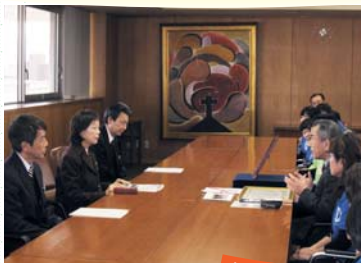
에비이 부지사가 경의를 표한 모습