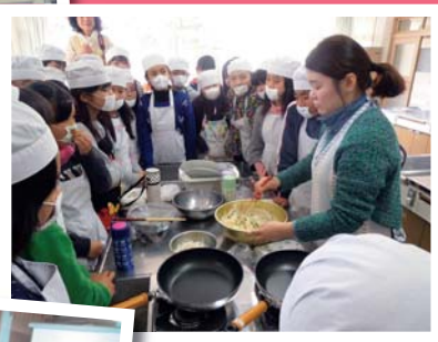
『세계에 GO! ~어린이의 다문화체험』