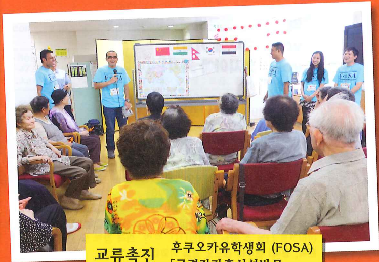
교류축진 후쿠오카유학생회 (FOSA) 「고령자간호시설방문」