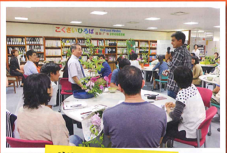
일본문화원 일본문화를 소개