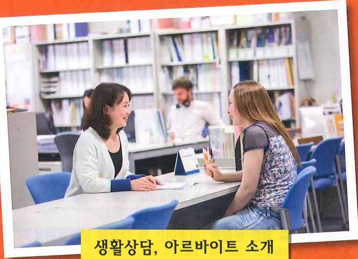
생활상담, 아르바이트 소개

고쿠사이히로바내 사무국인 후쿠오카현 유학생 서포트센터 운영협의회는 후쿠오카현내 유학생이 안심하고 생활할 수 있도록 서포트하고 있습니다!