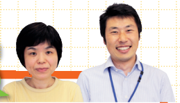
담당: 쿠라시게, 나카츠치

해외로 이주한 후쿠오카현 출신자와 그 자녀들에 의해 조직된 해외 후쿠오카현인회. 북미, 중남미 9개국 21곳에 있는 해외 후쿠오카현인회 여러분이 일제히 모이는 세계대회가 10월 후쿠오카현에서 개최됩니다. 기념식전과 고향 방문, 현인회 페어, 현인회 교류 사진전 등을 도와주실 볼런티어를 모집하고 있습니다.