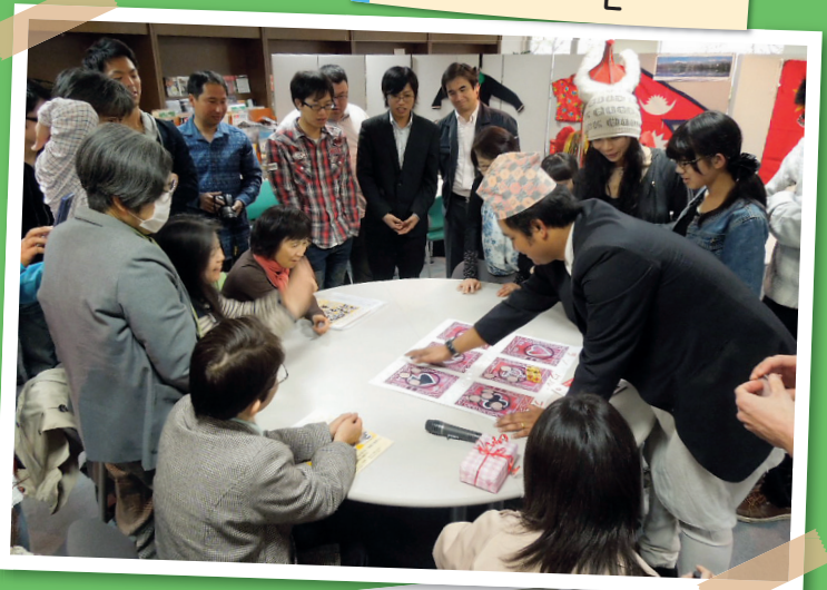
고쿠사이히로바 카페 '아시아편'