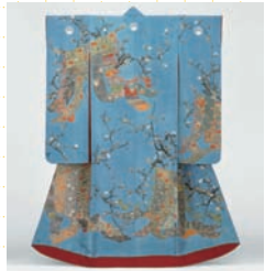
아사기(헤이켄지바)이주키초우모우후리시데 (푸른빛깔의 평직으로 판 실크에 매실나무가 그려진 예복) 보스텐미술관 소장 메이지시대(19세기) ※천기간 전시

일본의 전통문화에서 생겨난 '와(和)'의 아름다움을 대표하는 것 중 하나인 기모노. 그 화려한 역사의 두루마리 그림을 오비(허리끈)나 머리장식 등의 장신구와 기모노 미인을 그린 그림과 함께 전시. 전시 기간중의 주말에는 관련 이벤트가 가득. 티켓 반권으로 다양한 특전이 주어집니다.