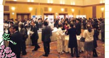
작년도 행사 풍경