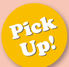
「고쿠사이히로바」를 찾아주신 분들