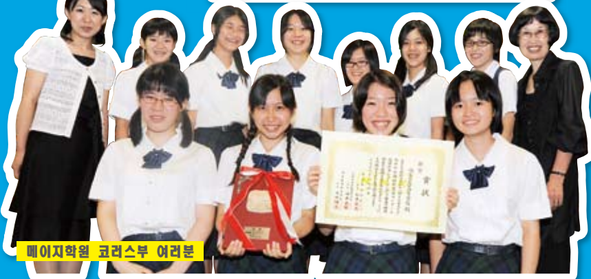
「고쿠사이히로바」를 찾아주신 분들