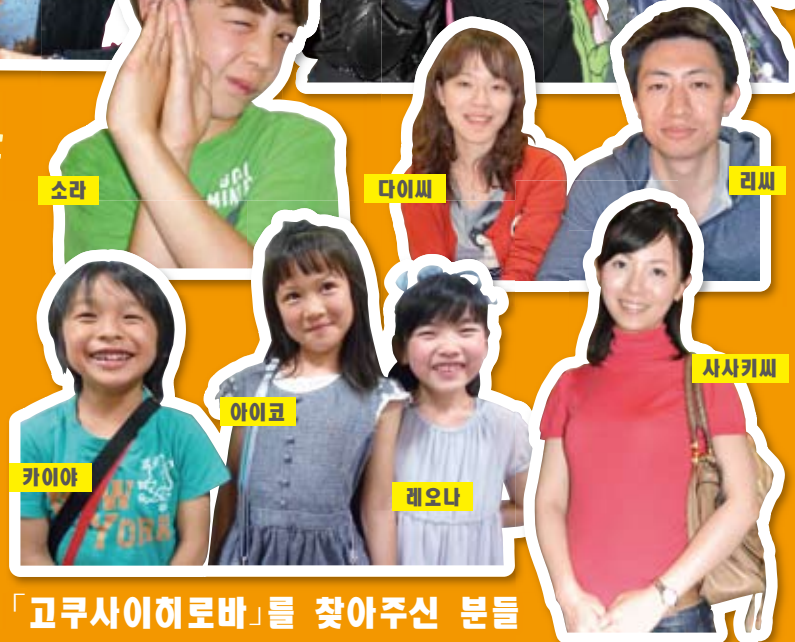
「고쿠사이히로바」를 찾아주신 분들

매 주 수 요 일 에 자원봉사로 일본어를 가르치고 있습니다. 일본어 교실에서 여러 나라의 사람들과 만나는 것이 저의 큰 즐거움입니다. 교실에서는 많은 분이 제로부터 일본어 학습을 시작하고 있습니다. 흥미가 있는 분은 꼭 한 번 교실을 찾아주세요.