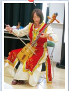
'수호의 하얀 말' 등 마두금연주를 통해 한국 문화를 소개하는 도란씨.