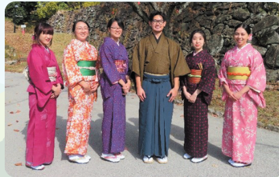
'기모노·다도 체험' 등 일본 문화를 체험합니다.

매년 해외 후쿠오카현인회 회원의 자녀를 1년 간 유학생으로 초청하고 있으며 2024년 4월 에는 6개국 7개 현인회에서 7명의 현비유학생이 후쿠오카로 유학을 옵니다. (브라질, 파라과이, 볼리비아, 멕시코, 페루, 미국) 현비유학생은 현 내 대학 등에서 전문 지식과 기술을 습득함과 동시에 후쿠오카현의 전통, 문화, 산업, 경제 등에 대해 이해를 넓힐 예정입니다.