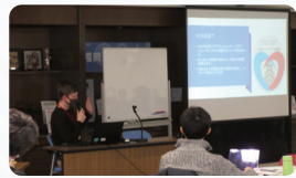
재해 세미나 모습

워크숍은 큰 지진이 발생했을 때를 가정하여 일본인 참가자가 자원봉사자 역할을 맡아 피난소를 순회하며 외국인의 고통을 듣는 연습을 했습니다. 재해 발생 시 외국인 문화와 언어의 차이로 인해 우리가 상상할 수 없는 고통이 있다는 것을 알았다.' 등의 후기가 있었습니다.