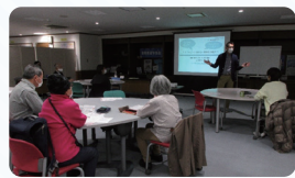
스킬 업 강좌 모습

금년도에는 '일본어를 전혀 하지 못하는 초심자를 위한 교육법', '일본어 학습자의 부자연스러운 화법과 그 원인', '기술을 활용하는 강사가 되는 것을 목표로'를 테마로 각각 온라인 강좌 1회, 대면 강좌 1회씩 총 6회 개최합니다.