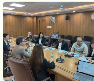
유학생 유치 활동(인도)

일본어 능력이 뛰어난 학생에게 후쿠오카현으로의 유학을 권장하기 위해 국내외 우수 일본어 교육 기관 및 각 귀국유학생회와 연계하여 후쿠오카현의 유학 환경과 회원 대학에 대한 정보를 제공하고 선배 유학생의 경험담을 소개하고 있습니다.