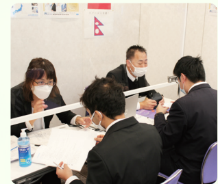
회사 합동 설명회 모습

현내 유학생을 대상으로 정사원 구인 소개와 개별 취업 상담, 취업 대책 세미나 등을 실시하고 있습니다. 2022년 12월 14일에는 '4월 입사를 희망하는 유학생을 위한 회사 합동 설명회'를 주최하여 현내를 중심으로 16개 기업이 참가했습니다.