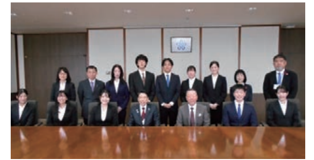
핫토리 세이타로 후쿠오카현지사 예방

저희 재단과 해외후쿠오카현인회의 협력으로 실시한 '국제인재 육성사업'으로 현내 대학생 등 10명이 4박 7일간의 일정으로 오스트레일리아(시드니)를 방문했습니다. 시드니 후쿠오카현인회의 협력으로 시드니에 있는 일본 정부 기관과 일본 기업 약 15사를 4개 그룹으로 나누어 각각 방문하여, 현지에서 비즈니스 연수 및 직업 체험 등을 실시하고, 현인회 회원과도 교류를 나누었습니다. 귀국 후에는 핫토리 현지사를 방문하여 성과를 보고하고, 지사님으로부터 격려의 말씀을 들었습니다. 그리고, 관계자를 대상으로 한 보고회에서는 시드니에서 도움을 주신 연수처 등과 온라인으로 연결하여, 참가 학생 각자가 이번 사업을 통해 깨달은 것과 달성하고자 했던 목표의 성취도 등에 대해서 발표했습니다.