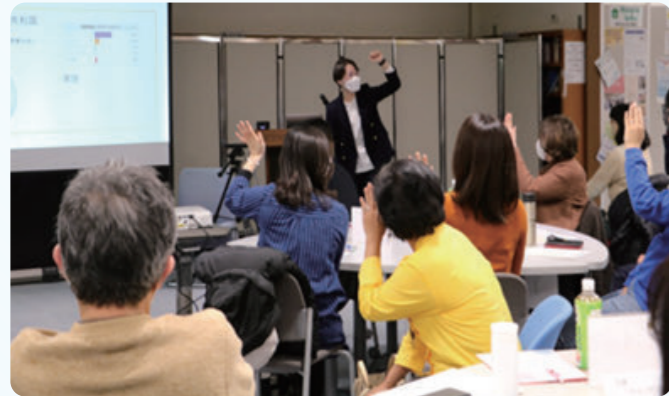
강사 스킬업 강좌

세계를 이해하고 생각하는 기회를 제공하기 위해, 현내의 학교 및 공민관 등에 외국인 강사나 외국에서의 활동 경험이 있는 일본인 강사를 파견 및 소개하고, 강사를 위한 스킬업 강좌, 어린이에서 성인까지 참여할 수 있는 국제교류 이벤트등을 정기적으로 개최하고 있습니다.