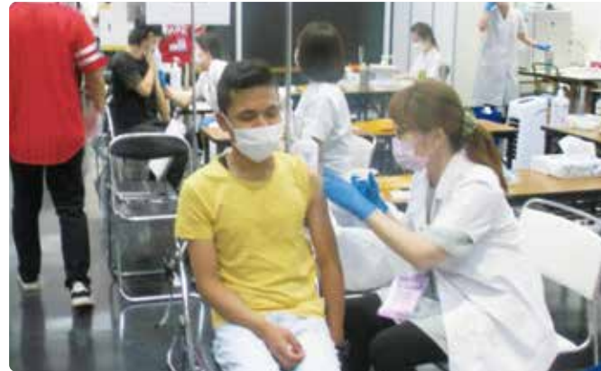
백신 접종 모습