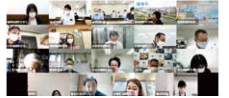
온라인 회의 모습