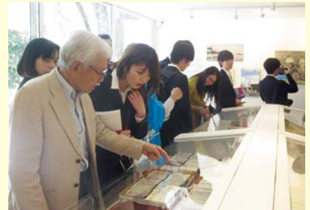
멕시코 (일본인 멕시코 이주 아카데미기념관 견학)