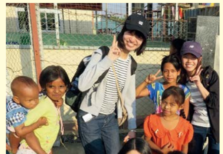
미얀마 (미얀마 어린이들과 스레기 즐기)

미얀마 연수 보고회 헤이세이 31년 3월 31일(일) 14:00 ~ 15:00 고쿠사이히로바(아크로스후쿠오카 3F)