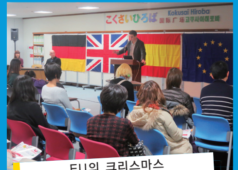
EU의 크리스마스 (후쿠오카 EU협회·EUIJ규슈)