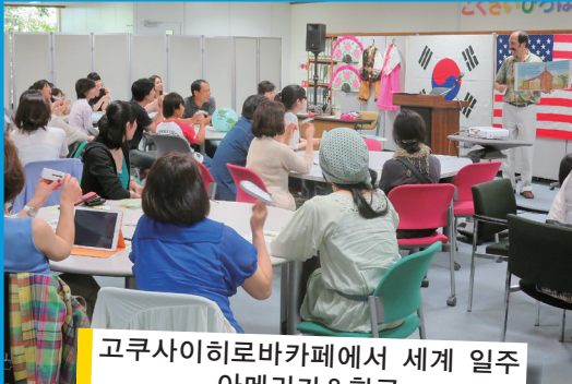
고쿠사이히로바카페에서 세계 일주 아메리카&한국

후쿠오카현 국제교류센터「고쿠사이히로바」에서는, 현 내에 있는 여러 NPO 및 국제교류단체 등과 함께 현민의 국제화, 국제 교류에 대한 이해를 돕기 위한 이벤트를 개최하고 있습니다.