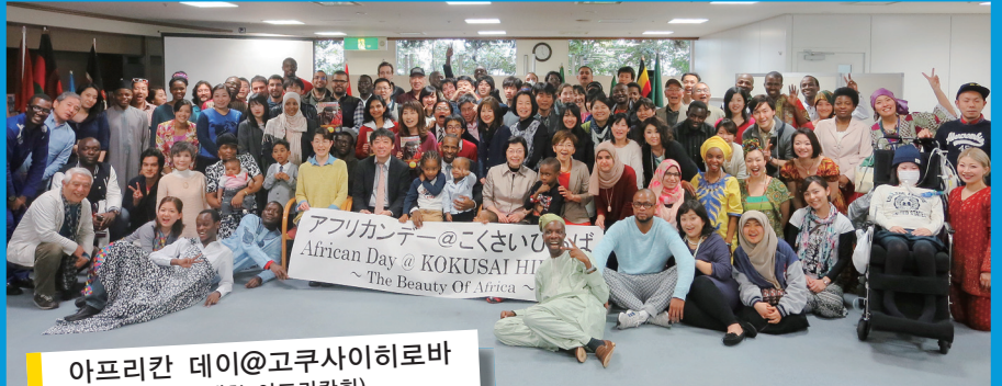
아프리카 데이@고쿠사이히로바 (규슈대학 아프리카회)