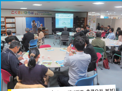
해비타트 히로바 (UN 해비타트 후쿠오카 본부)