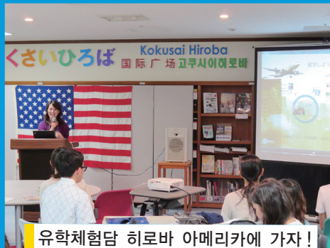
유학체험담 히로바 아메리카에 가자! (후쿠오카 아메리칸센터)