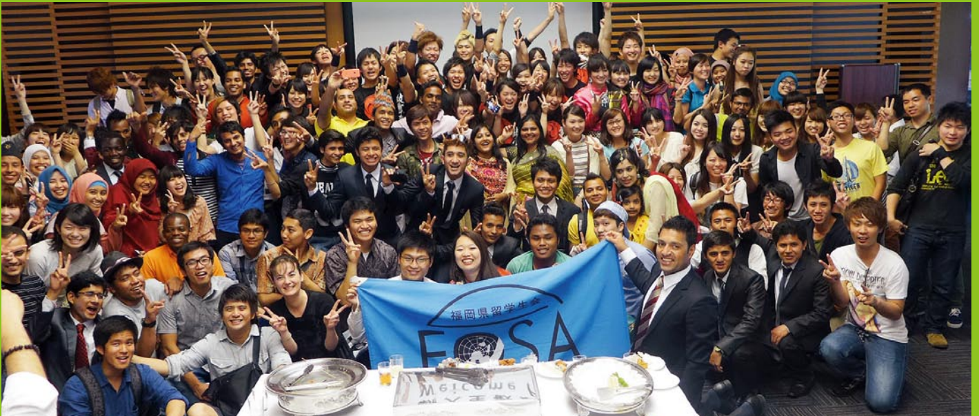
후쿠오카 현 유학생회(FOSA) "Welcome Party 2014"

(공재)후쿠오카현 국제교류센터에서는 현내의 대학, 자치체, 경제단체 등과 함께 후쿠오카 현 내에서 유학하고 있는 학생들에게 생활 상담이나, 취업활동 지원, 아르바이트 소개, 장학금 지원, 지역주민과의 교류축진을 위한 다양한 사업을 하고 있습니다.