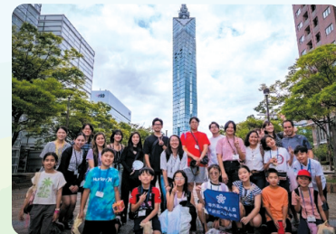
「県人会子弟招へい事業」福岡県の魅力を、次世代の子弟に伝えます。