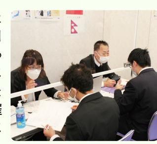
会社合同説明の様子

県内の留学生を対象に、正社員の求人紹介や個別の就活相談、就活対策セミナー等を行っています。令和4年12月14日には「4月入社を目指す留学生のための合同会社説明会」を主催し、県内を中心に16社の企業にご出展いただきました。