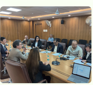
留学生誘致活動(インド)

日本語能力の高い学生に福岡県への留学を働きかけるため、国内外の優秀な日本語教育機関や各帰国留学生会と連携して、福岡県の留学環境や会員大学についての情報を提供したり、先輩留学生の声を紹介したりしています。