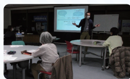
スキルアップ講座の様子

日本語教育支援事業の一環として、日本語教室で活動されている日本語ボランティアや日本語教育に興味をお持ちの方等を対象に、スキルアップ講座を実施しています。今年度は「全く日本語が話せないゼロ初級者への教え方」、「日本語学習者の不自然な発話とその原因」、「テクノロジーを使いこなす教師を目指そう」をテーマにそれぞれオンライン講座1回、対面講座1回計6回開催しました。