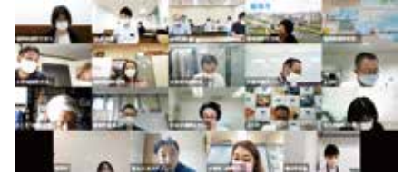
オンライン会議の様子

また福岡県国際交流センターおよび福岡県国際局から、外国人支援に関する情報発信をいたしました。外国人に対する様々な支援について知ることができる有意義な会議となりました。