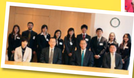
◀移住者子弟留学生

カナダ、アメリカ、メキシコ、 コロンビア、ペルー、 ブラジル、ボリビア、 パラグアイ、アルゼンチン