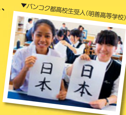
▼バンコク都高校生受入(明善高等学校)