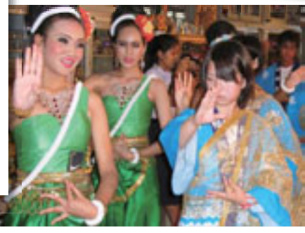
▲福岡県高校生バンコク都派遣