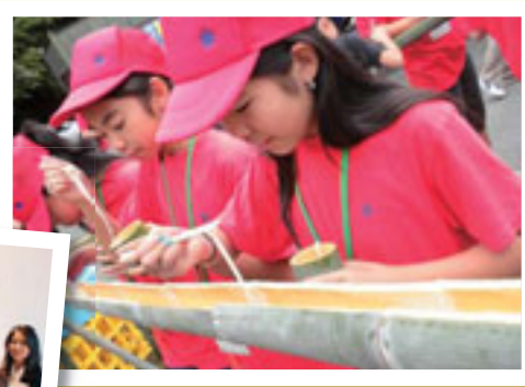
▲県人会子弟招へい