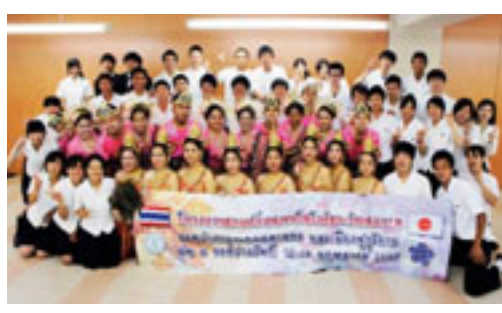
▲バンコク都高校生受入(柳川高等学校)

ハワイ州 (アメリカ)、江蘇省 (中国)、 バンコク都 (タイ)、デリー州 (インド)、 ハノイ市 (ベトナム)、韓国南岸の一市三道