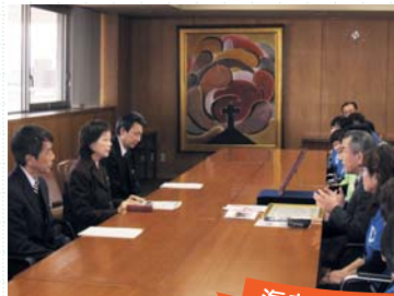
海老井副知事表彰の様子