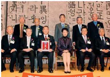
高円宮賞受賞の様子