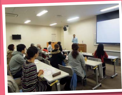
講師スキルアップ講座