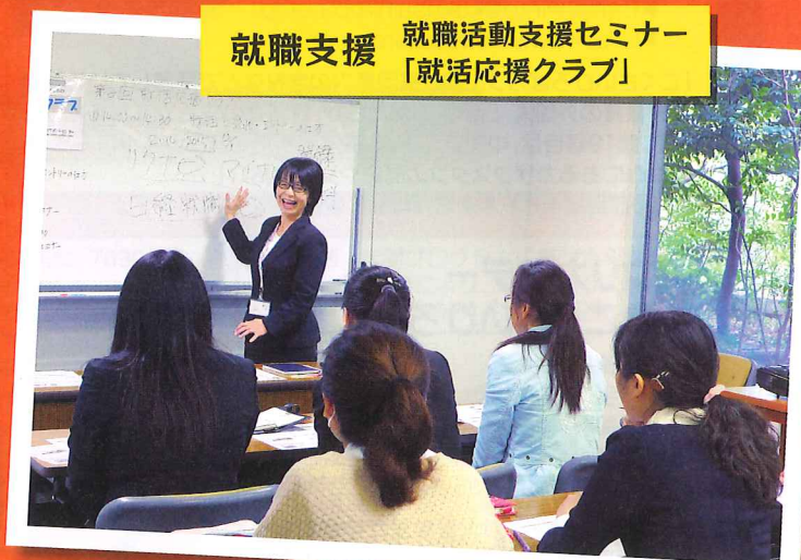
就職支援 就職活動支援セミナー 「就活応援クラブ」