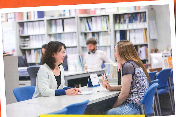
生活相談・アルバイト紹介

こくさいひろばに事務局のある福岡県留学生サポートセンター運営協議会は、福岡県で学ぶ留学生が安心して留学生活を送れるようにサポートしています！