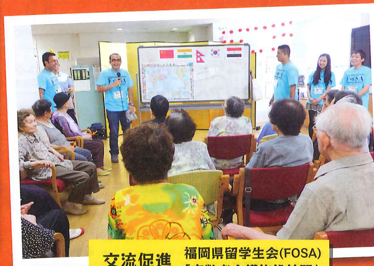
交流促進 福岡県留学生会(FOSA) 「高齢者介護施設訪問」