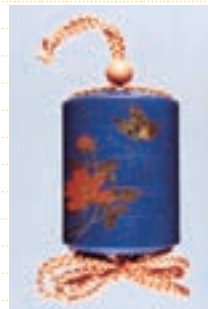
牡丹蝶絵印籠 江戸時代 19世紀 クレスコレクション

江戸時代、男性のお洒落アイテムとして人気を博した印籠。その美しさに魅了されたフィンランドの著名な印籠コレクター、ハインズ・クレス氏、エルセ・クレス氏ご夫妻所蔵の印籠を紹介します。