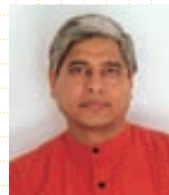
ヴィカース・スワループ 在大阪インド総領事

フェアでは、アカデミー賞を受賞した映画『スラムドッグ$ミリオネア』の原作者であるヴィカース・スワループ在大阪インド総領事による講演及び民族音楽研究演奏家の若林忠弘氏による「インド古典音楽」の演奏が行われます。