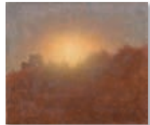
高島野十郎 「秋陽」1965年頃 福岡県立美術館蔵

団体料金 一般160円・高大生140円・小中生50円 ギャラリートーク 土曜日 午後2時~