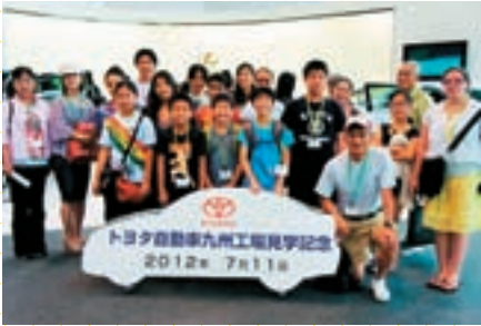
トヨタ自動車九州工場見学

交流や体験などを通して、ルーツである福岡、日本についての理解を深めるために、県人会会員の子どもたち（小学校高学年）を福岡県に招いています。今年7月に実施し、10県人会から子弟19名、引率者10名が参加しました。