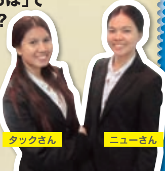
福岡工業大学と提携を結んでいる、タイ王立キングモンクット工科大学の学生

こくさいひろばにある、福岡県留学生サポートセンターでインターンシップをしています。 たった3日間ですが、ビジネス日本語やマナーを学んだり、福岡県留学生サポートセンターのFacebookでタイのことを紹介したり、いろんな体験ができました!