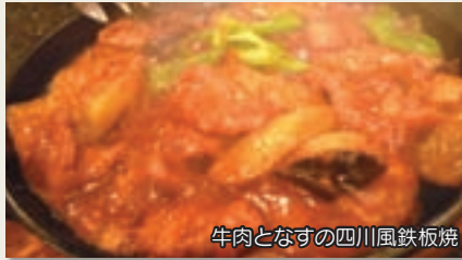
牛肉となすの四川風鉄板焼