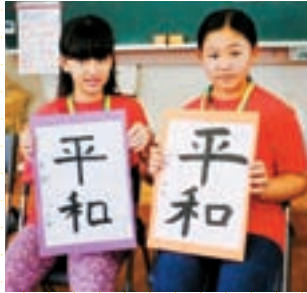
那珂小学校で書道体験