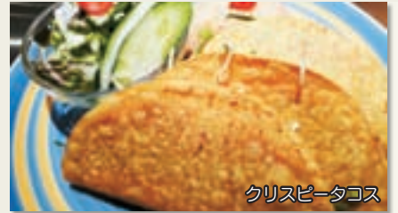
クリスピータコス

2013年2月限定 4名様までワンドリンクサーブ(生ビール・グラスワイン・ソフトドリンクの中から)