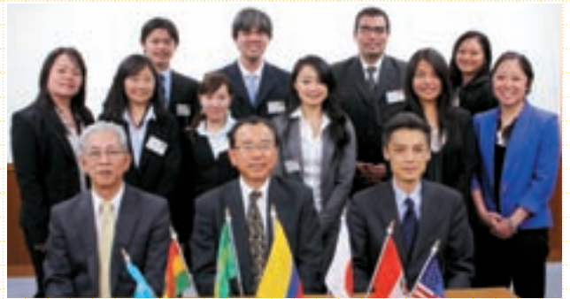
平成24年度の移住者子弟(県費)留学生

大学等での専門知識の習得と福岡県への理解を深めるため、県人会会員等を1年間留学生として受け入れています。今年8月には8県人会から10名が来日しています。