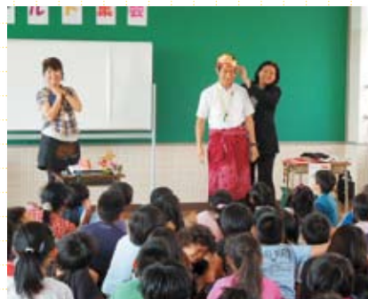
城浜小学校での 国際理解教育授業の様子