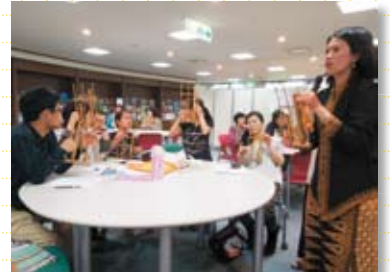
インドネシアの楽器に挑戦