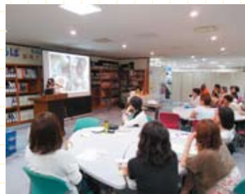
ガーナの「これ何だろう？」クイズ