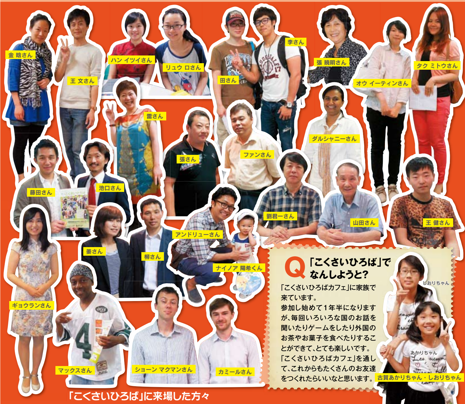
「こくさいひろば」に会場した方々