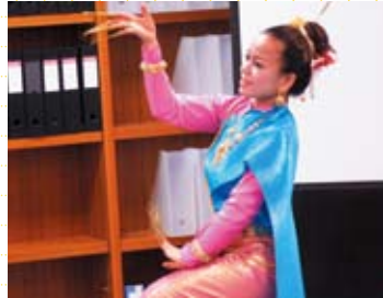
タイ人講師による舞踊