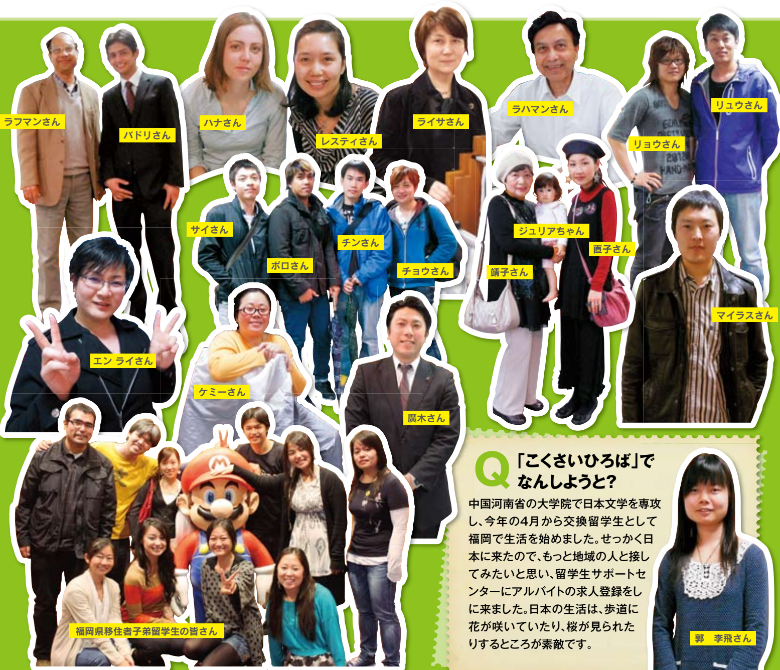
「こくさいひろば」に会場した方々