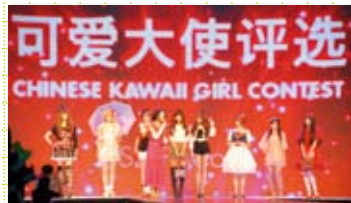
2011年9月に中国大連で開催したウェブ投票の予選撮影会の様子

福岡アジアコレクション(FACo) 豪華なゲストやアーティスト、地元ブランドの参加で、日本3大リアルクローズファッションショーにも数えられる大型ファッションイベントです。 開催日：2012年3月25日(日) 会場：福岡国際センター（福岡市博多区築港本町2-2） 公式HP：http://faco.jp 問合せ先：福岡アジアコレクション事務局 / 092-844-8837