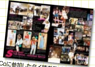
FACoに参加したタイ読者モデルの活躍を報じた日系ファッション誌のタイ語版「S Cawaii!」