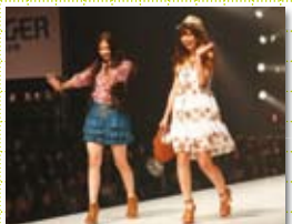
2011年3月のFACoに参加したタイの読者モデル

毎年3月に福岡で開催される大型ファッションショー「福岡アジアコレクション（FACo）」との連動企画では、ステージに登場するアジアの読者モデルをアジアビートウェブサイトの人気投票で選出するコンテストを実施。今年も中国、台湾、タイからウェブ投票で選出された上位各2名が「asianbeat×FACoカワイイ大使」として夢のランウェイを歩きます。