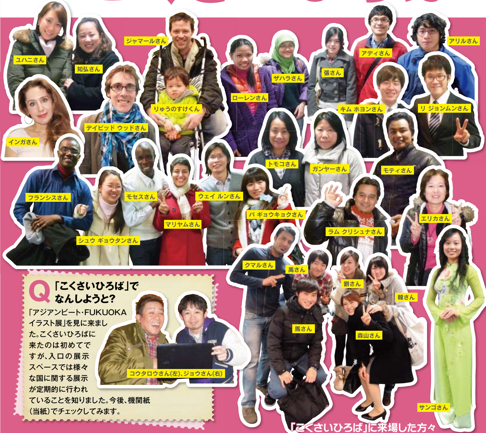
「こくさいひろば」に来場した方々