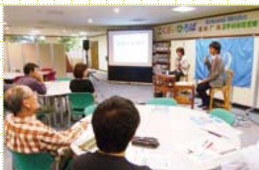
前回のハビタットひろばの様子

国連ハビタット福岡本部と(財)福岡県国際交流センターによる合同レクチャーシリーズ。第5回目は国連ハビタット福岡本部が2009年より行っている、アジアへ向けた環境技術に関する取組がテーマです。