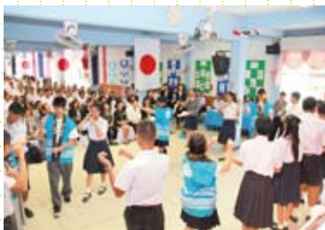
バンコクでの高校生の交流の様子

今年8月、当センターで初めて、県内の高校生をバンコク都へ派遣するプログラムを実施しました。このプログラムに参加した高校生6名が、現地でのような体験をし、何を感じ、考えたのか？高校生の熱い思いを、ぜひ会場でお聞きください！ *時間：14:00～15:00