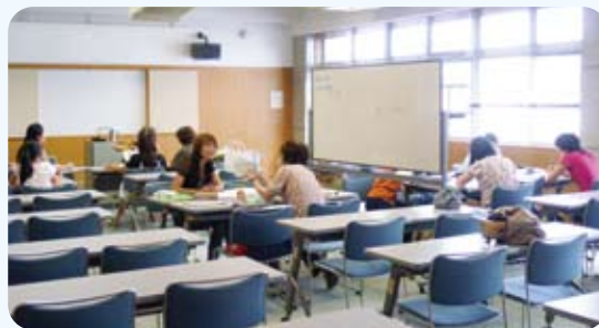
◀初級・中級・上級のクラスに分かれて学習しています。

A.日本語が上達した生徒たちが、北九州おしゃべりコンテストに出場したり、学習者全員で、日本語で文集を作ったりしたこと。和気あいあいとした環境で、交流を深めながら学習できるところが魅力です。