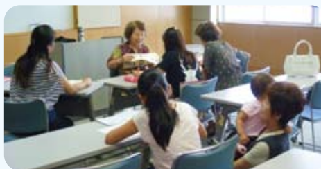
◀上級クラスの授業の様子

A.漢字を勉強していきたいです。小学4年生になる娘の方が、漢字が得意なので、負けずがんばりたいです。