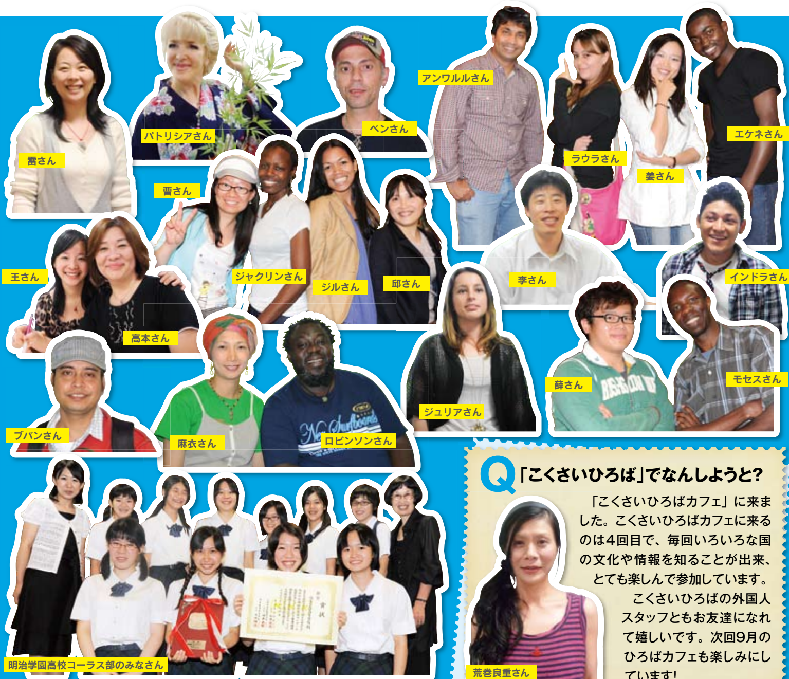
「こくさいひろば」に来場した方々