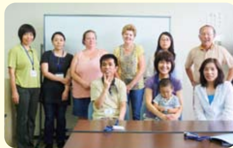
◀ボランティアの先生と学習者のみなさん

A.英語圏出身で日本語を1から学び始める方が多いため、日本語と英語と一緒に書かれた教材を選んだり、私たち自身も英語を勉強したりと工夫しています。また、生活面でもサポートできるよう、これから経験を積んでいきたいと思ひます。