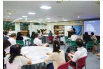
前回のハビタットひろばの様子

国連ハビタット福岡本部と(財)福岡県国際交流センターによる合同レクチャーシリーズ「ハビタットひろば」。第4回目は防災教育についてお話しします。