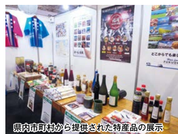
県内市町村から提供された特産品の展示