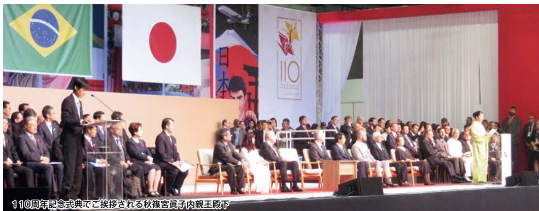
110周年記念式典でご挨拶される秋篠宮眞子内親王殿下

また、7月20日から22日の3日間、記念式典にあわせて、日本の食と文化を発信する世界最大の日系人の祭典である「日本祭り」が開催されました。福岡県もブースを設置し、県内市町村からご提供いただいた特産品の展示や、八女茶の試飲を行いました。また、太宰府の「梅酒」や「梅ヶ枝餅」を展示、提供し、太宰府の観光PRも行いました。