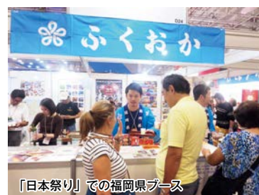
「日本祭り」での福岡県ブース