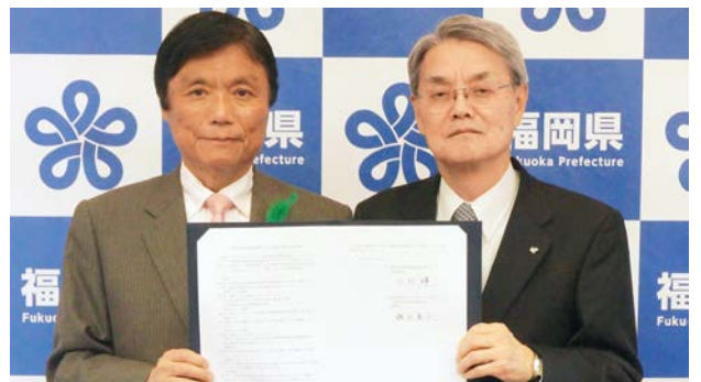
平成30年4月16日 福岡県と支援センター設置・運営に係る協定を締結 小川洋福岡県知事(左)と藤永憲一福岡県国際交流センター理事長