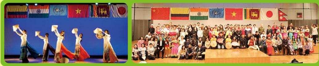
▲FiSSC設立10周年記念交流会