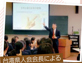
台湾県人会会長によるセミナー