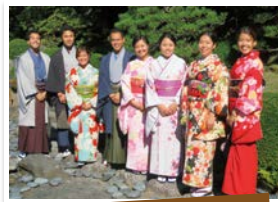
福岡県移住者子弟留学生

福岡県を故郷に持つ人々で組織した海外福岡県人会は、現在、世界23の国・地域に38か所あります。海外福岡県人会は、本県とそれぞれの国・地域をつなぐ架け橋として貴重な財産であり、海外との交流において、重要な役割を担っています。