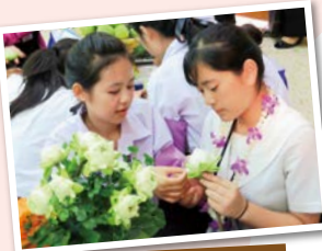
バンコク都との交流

当センターは、各県人会の後継者育成や、ネットワークの構築を図るため、各県人会の周年事業への訪問団派遣、県人会子弟の受け入れ、県内の青年派遣、海外で活躍する本県出身者を招いてのセミナー等、様々な事業を実施しています。