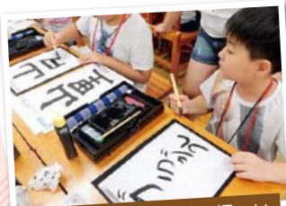
県人会子弟(小学生)の招へい

タイ・バンコク都とは、平成18年に友好提携協定を締結し、平成22年度から高校生の相互交流を行っています。例年5月に、バンコク都の高校生が福岡県を訪れ、8月には、県内の高校生をバンコク都へ派遣しています。両県都において、現地高校との交流やホームステイ、文化体験等を行っています。