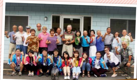
ハワイの県人会への青年派遣