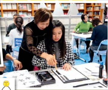
▲日本文化塾「書き初め」体験