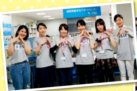
◀学生ボランティアスタッフ「おむすびぐみ」のみなさん

Facebook: https://www.facebook.com/fukuoka.fissc