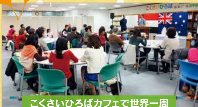
こくさいひろばカフェで世界一周 エジプト&オーストラリア

福岡県国際交流センター「こくさいひろば」では、県内のさまざまなNPOや国際交流団体等と共催し、県民の国際化、国際交流に対する理解を深めるためのイベントを開催しています。