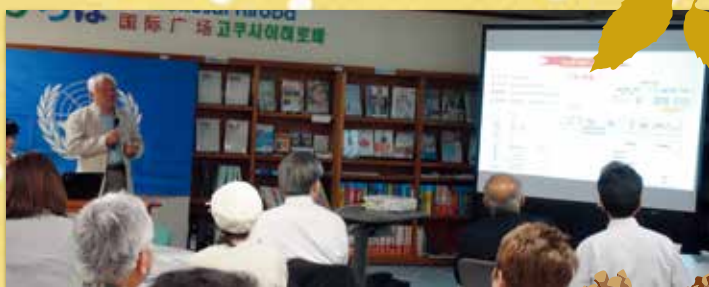
ハビタットひろば(国連ハビタット福岡本部)