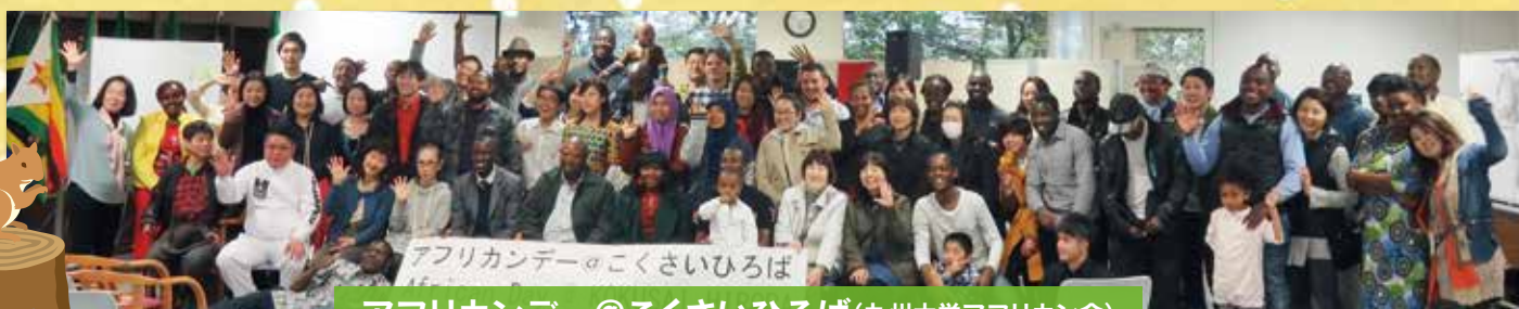
アフリカンデー@こくさいひろば(九州大学アフリカン会)