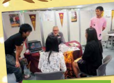
留学体験談ひろば アメリカへ行こう! (福岡アメリカンセンター)