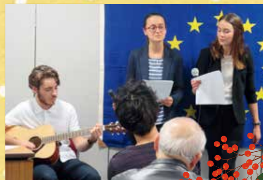
EUのクリスマス (福岡EU協会・EUI九州)