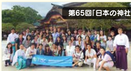
第65回「日本の神社と神様—太宰府天満宮—」