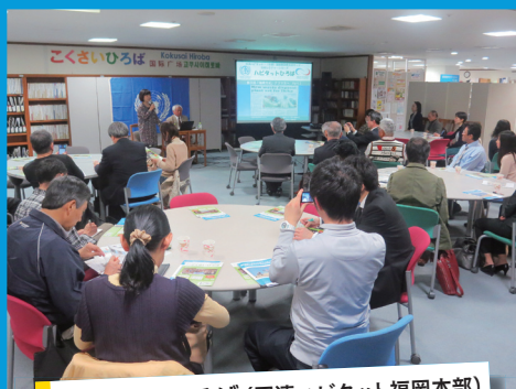
ハビタットひろば (国連ハビタット福岡本部)