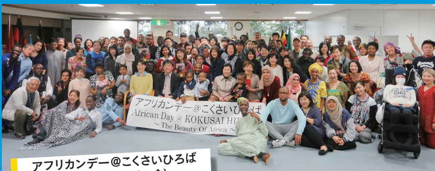
アフリカンデー@こくさいひろば (九州大学アフリカン会)