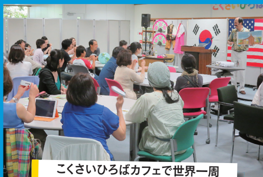
こくさいひろばカフェで世界一周 アメリカ&韓国

福岡県国際交流センター「こくさいひろば」では、県内のさまざまなNPOや国際交流団体等と共催し、県民の国際化、国際交流に対する理解を深めるためのイベントを開催しています。