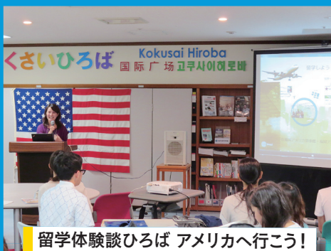
留学体験談ひろば アメリカへ行く! (福岡アメリカンセンター)