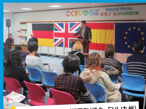
EUのクリスマス (福岡EU協会・EUIJ九州)