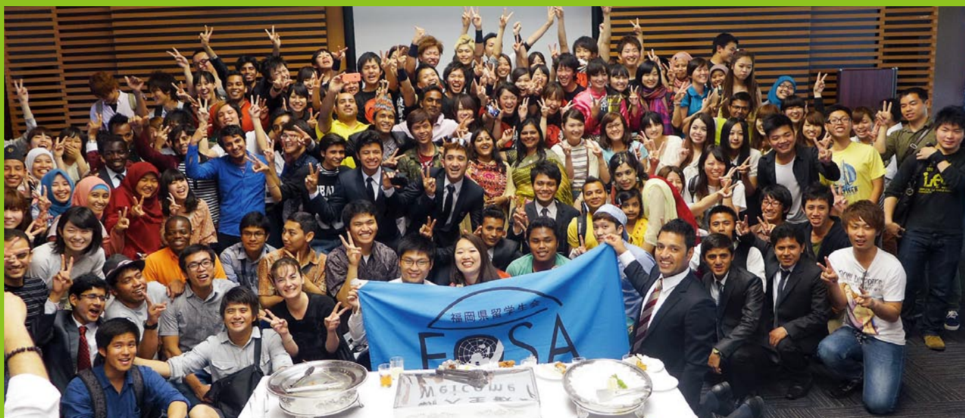
福岡県留学生会(FOSA) "Welcome Party 2014"

福岡県には、東京都、大阪府に次ぐ9,000人を超える留学生が学んでいます。 (公財)福岡県国際交流センターは、県内の大学、自治体、経済団体等と一緒に、福岡県内で学ぶ留学生の生活相談や就職支援、アルバイト紹介、奨学金の支給、地域の方々との交流促進など様々な事業を行っています。