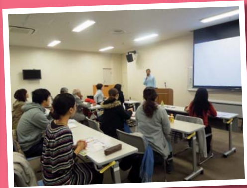
提高讲师素质讲座