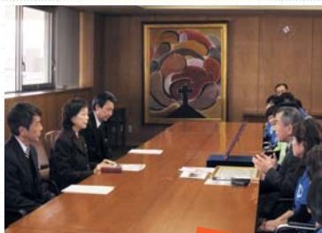
拜访海老井副知事