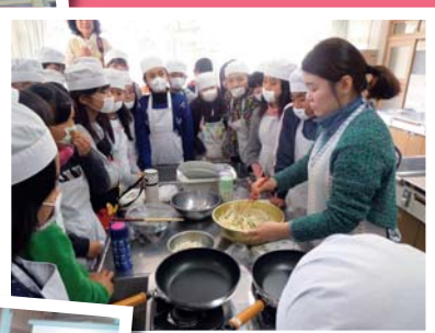
「奔向世界!」 ~儿童体验多种文化~