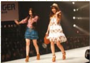
2011年3月被评选出参加《福冈亚洲时装秀》的泰国读者模特

每年三月与福冈大型时装展《福冈亚洲时装秀》(FACo)的互动计划中都有从亚洲读者模特选出登台参赛的大奖赛。今年也将从中国、台湾、泰国网站选出的前两名为《asianbeat FACO 可爱大使》在红地毯上亮相,定会梦想成真。