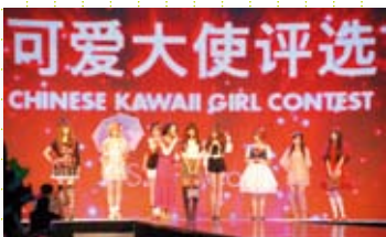
2011年9月在中国大连举办“投票预选摄影”会场情景