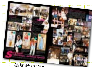
参加并报道FACo泰国读者模特风采的日裔泰文时装杂志《S Cawaii!》