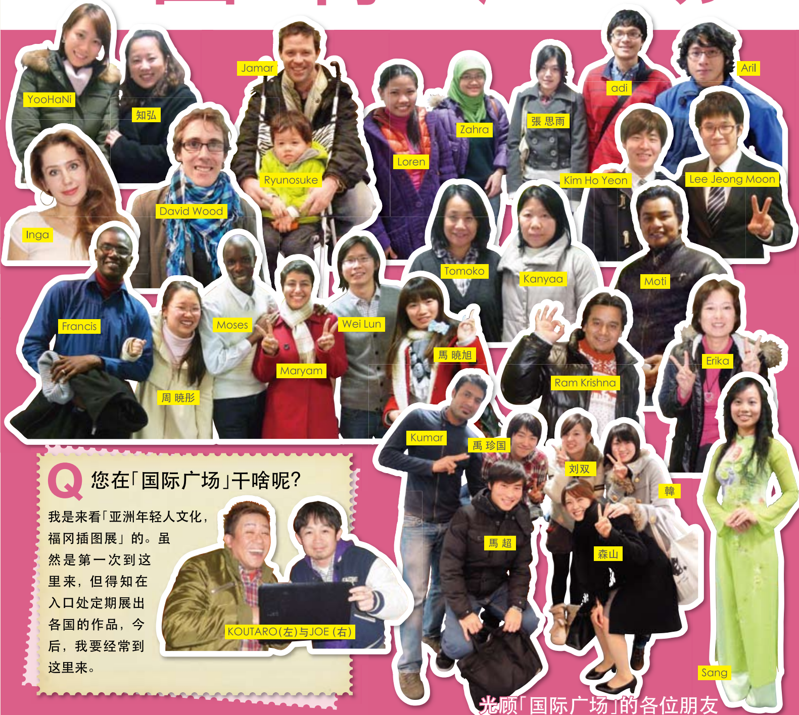
光顾「国际广场」的各位朋友