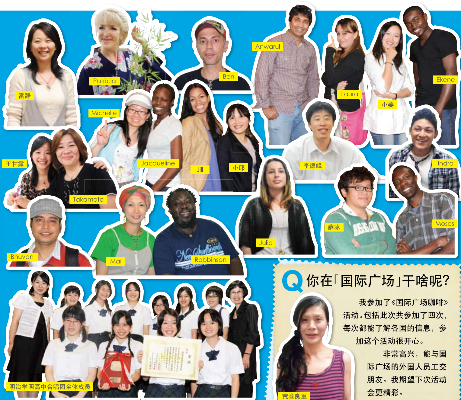
光顾「国际广场」的各位朋友