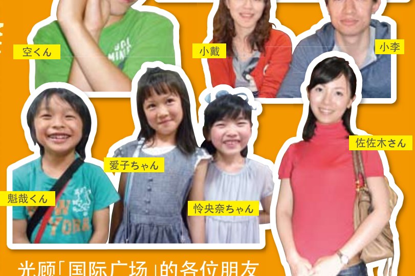
光顾「国际广场」的各位朋友