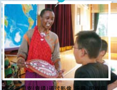
新莱蒂里克(音译)通过影像、书籍、民族服装向同学们介绍肯尼亚国情。

向县内中小学、高中,特别支援学校等派遣在福冈的留学生及在海外具有义工活动经验的日本人讲师。