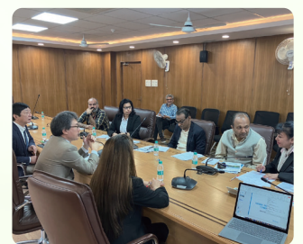
留学生招生活动(印度)

为了鼓励日语水平高的学生到福冈县学习,我们与国内外优秀的日语教育机构以及各归国留学生协会合作,提供福冈县及其成员大学的学习环境信息,并介绍资深留学生的的心声。