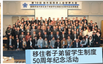
移住者子弟留学生制度50周年纪念活动