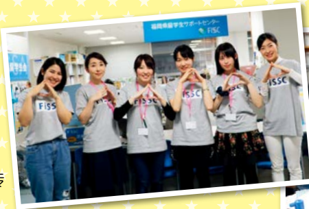
◀“奥姆斯比组”的学生志愿者工作人员

Facebook: https://www.facebook.com/fukuoka.fissc