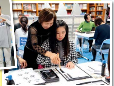
▲日本文化塾 体验「新春试笔」