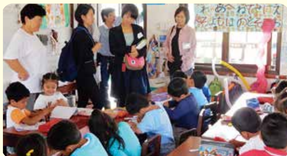
全球舞台(2015年·玻利维亚/学校访问)