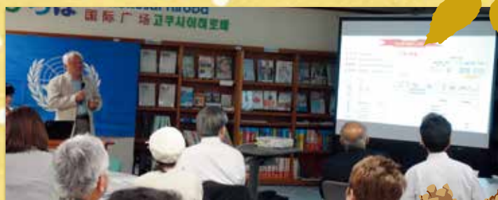
人居署广场 (联合国人居署福岡总部)