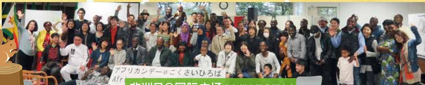
非洲日@国际广场 (九州大学非洲会)