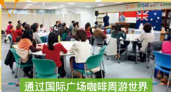
通过国际广场咖啡周游世界 埃及&澳大利亚

福岡县国际交流中心“国际广场”与县内各个NPO团体及国际交流团体携手合作，为提高县民的国际化意识，促进国际理解，共同举办各种国际交流活动。