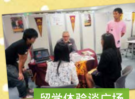
留学体验谈广场 去美国吧! (福岡美国中心)