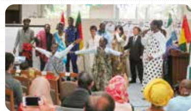
去年举办时的样子▶

由九州大学的非洲留学生来为大家介绍非洲。内容从近几年持续成长中非洲的面貌到非洲各国的传统音乐、服装、舞蹈等应有尽有。