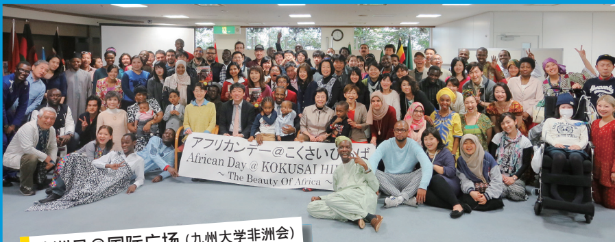
非洲日 @ 国际广场 (九州大学非洲会)