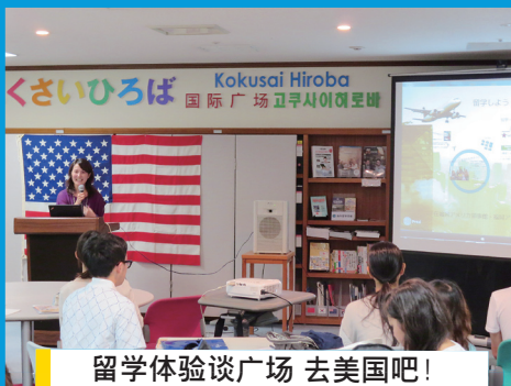
留学体验谈广场 去美国吧! (福岡美国中心)