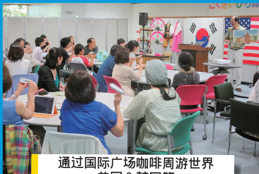
通过国际广场咖啡周游世界 美国 & 韩国篇

福岡县国际交流中心“国际广场”，与县内多个NPO以及国际交流团体等合作,为提高县民的国际化意识,促进国际理解,共同举办各种国际交流活动。