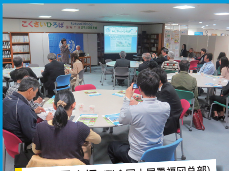
人居署广场 (联合国人居署福岡总部)