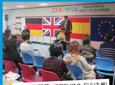
EU的圣诞节 (福岡EU协会·EUIJ九州)