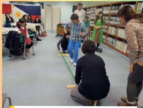
国际广场咖啡～东南亚篇～