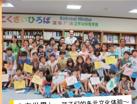
走向世界！～孩子们的多元文化体验～