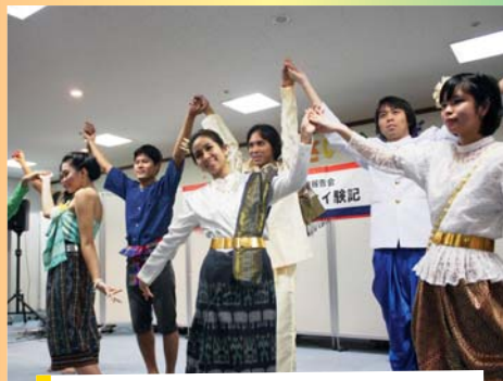
福岡县/曼谷青少年交流体验报告会