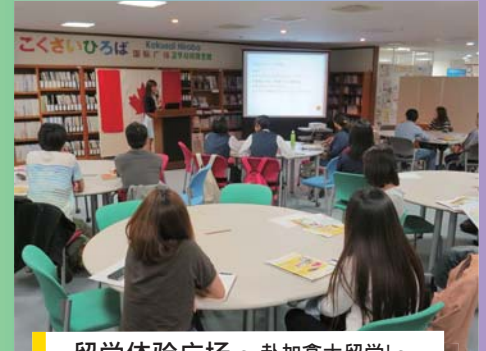
留学体验广场～赴加拿大留学！～