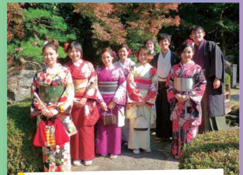
移居海外者子弟留学生～体验穿着和服～