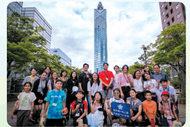
Chương trình "Tuyển sinh con em hội đồng đồng hương tỉnh Fukuoka" Chúng tôi sẽ truyền tải sức hấp dẫn của tỉnh Fukuoka đến thế hệ trẻ em tiếp theo.