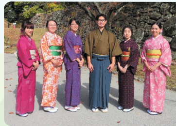
Trải nghiệm văn hóa Nhật Bản với: Học cách mặc Kimono, Trải nghiệm trà đạo, vv..

Chương trình tiếp nhận du học sinh con em người Fukuoka định cư ở nước ngoài Tỉnh Fukuoka tiếp nhận du học sinh con em người Fukuoka định cư ở nước ngoài theo học bổng của tỉnh trong một năm. Vào tháng 4 năm 2024, 7 du học sinh nhận học bổng của tỉnh sẽ đến Fukuoka từ 7 hội đồng đồng hương ở 6 quốc gia (Brazil, Paraguay, Bolivia, Mexico, Peru, Hoa Kỳ). Du học sinh nhận học bổng của tỉnh Fukuoka sẽ học tập tại các trường đại học và cao đẳng trong tỉnh để trau dồi kiến thức và kỹ năng chuyên môn, đồng thời nâng cao hiểu biết về văn hóa, truyền thống, công nghiệp và kinh tế của tỉnh Fukuoka.