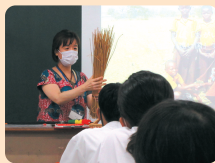
Tình hình lớp học

Bạn có muốn trở thành giảng viên chia sẻ văn hóa, lịch sử quê hương và kinh nghiệm hoạt động ở nước ngoài cho trẻ em và người dân địa phương không? Hãy tham gia chương trình giảng viên của chúng tôi! Xin vui lòng liên hệ trước với trung tâm của chúng tôi. Chúng tôi rất mong nhận được đơn đăng ký của bạn!